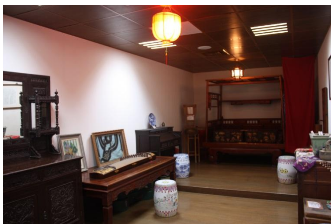
▲ 人文藝術~女子書房