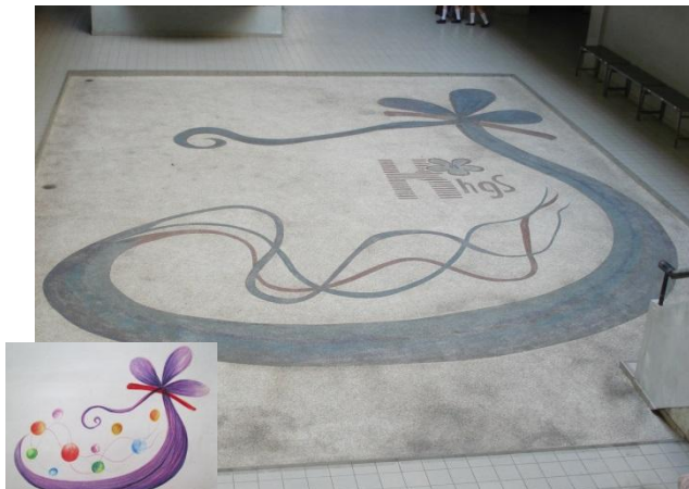
▲ 創意飛揚~三代同堂